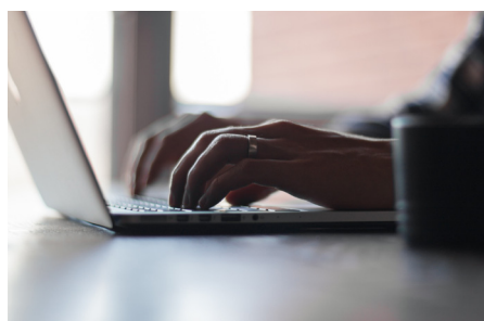
Hackeři útočili v Česku na každou pátou firmu