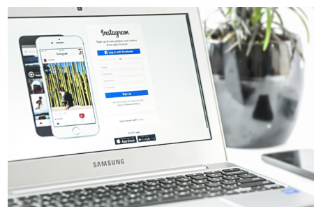
Jak se bránit proti stalkerwaru