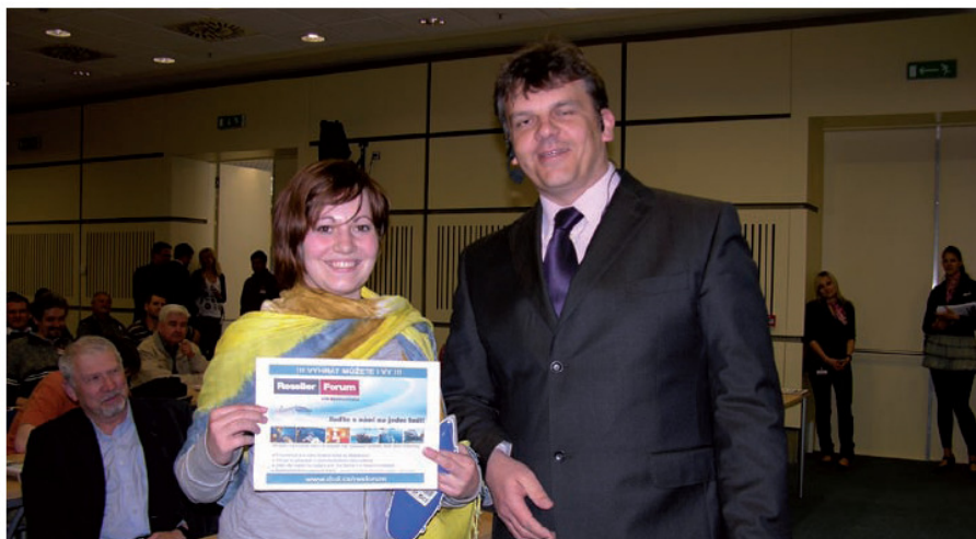
Letošní další šťastný výherce už je s námi na jedné lodi! Na podzim letošního roku si z paluby luxusní lodi prohlédne malebné zákoutí Středomoří